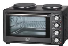
Electric Oven With HOB AD 6020