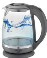
ELECTRIC KETTLE AD 1286