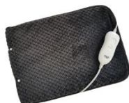
HEATED PAD AD 7433