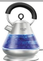
Electric Kettle AD 1282