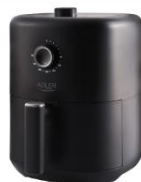
AIR FRYER AD 6310