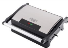
ELECTRIC GRILL AD 3052