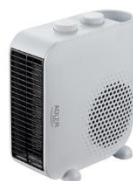
FAN HEATER AD 7725