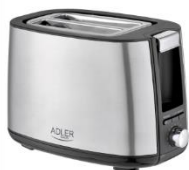
TOASTER 2 SLICE AD 3214