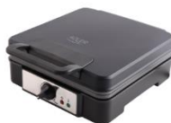
WAFFLE MAKER AD 3049