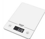
KITCHEN SCALE AD 3170