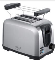
TOASTER 2 SLICE AD 3222