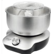
MIXER WITH BOWL AD 4222