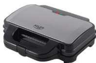
SANDWICH MAKER AD 3043