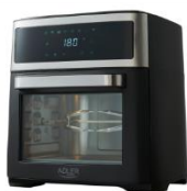
AIR FRYER OVEN AD 6309