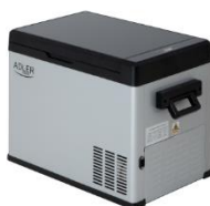
PORTABLE FRIDGE AD 8077