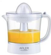
CITRUS JUICER AD 4009