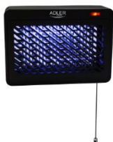
MOSQUITO LAMP AD 7938