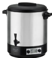
PASTEURIZATION POT AD 4496