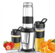
PERSONAL BLENDER AD 4081