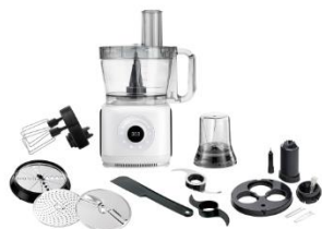
FOOD PROCESSOR AD 4224