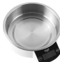
KITCHEN SCALE AD 3166