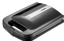
Sandwich Maker AD 3055