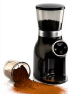
Burr Coffee Grinder AD 4450