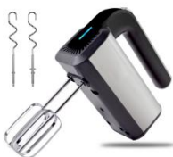
MIXER AD 4225