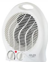
FAN HEATER AD 7728